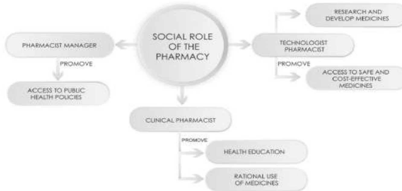
Fig. 1. Figure describes the categories of this topic.

Exploratory Research in Clinical and Social Pharmacy 13 (2024) 100405